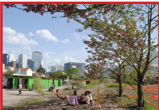
Photocréditée : Bercy beaucoup Yes we camp