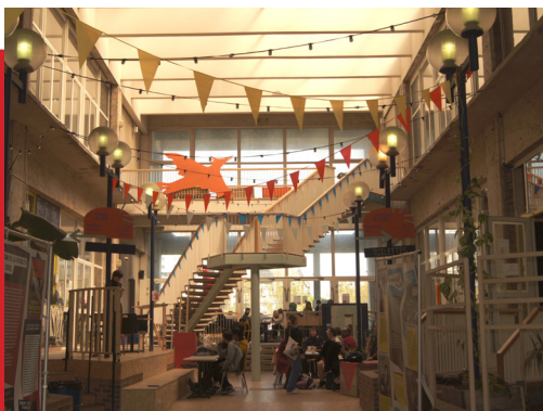
Photocréditée : Amarres Yes we camp